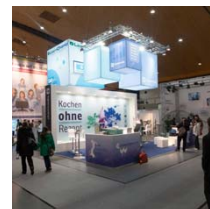
Chemmedia-Stand auf der Learntec 2014