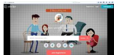
Screenshot Startseite www.jobclipr.com